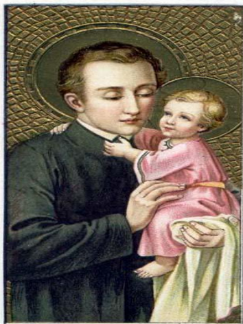
ST. STANISLAUS KOSTKA

Sveti Stanislav Kostka je vzornik mladih. Bil je živahne narave in vročehrvnega značaja. Vendar se je zavedal, da je življenje velik Božji dar. Zato je tovarišem, ki so ga velikokrat hoteli zvabiti k svojim zabavam, popivanju in veseljačenju, vedno odgovarjal: »Za kaj višjega sem se rodil«. To jih je jezilo in zato so ga večkrat surovo pretepali. Ko je spoznal, da ga Bog kliče k jezuitom, je šel k njim kljub očetovim grožnjam, da ga bo vrgel v ječo, če ne odneha. Zaradi bolezni je komaj 18-leten umrl v Rimu na veliki šmaren 1568.